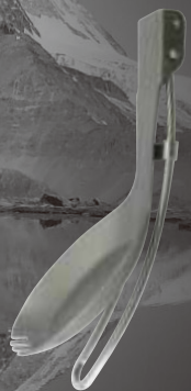
Folding handle Poignée repliable

La poignée repliable rend le produit compact lors de son rangement. Le titane dans la cuvette de la cuillère-fourchette rend ce produit ultra léger. Poignée en acier inoxydable, ergonomiquement conçue pour une haute résistance